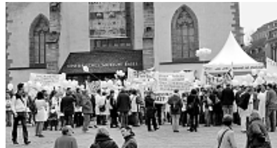
Ärztestreik auf dem Barfi, auch mit Ärzten aus dem Gundeli (wer sucht, der findet).

reits wollte wissen, dass ein Entscheid des BAV (Bundeamt für Verkehr) den Cortège verbieten will, weil dieser den öffentlichen Verkehr behindere. Auch hier: April, April!!! Der EHC Basel plant eine Namensänderung: Zum Beispiel die EHC Basel Sharks , hai-ai-ai. Und das war kein Aprilscherz sondern bitterer Ernst. Im Eishockey müssen halt die Clubs englisch tönen, das ist hip! Wirklich? Eine Amerikanisierung des Clubnamens bringt aber noch lange keine verbesserte und erfolgreiche Spielkultur. «Wäge däm spiilet ihr au nit besser! – Hopp EHC!». Der HC Davos , ohne tierlichen Zusatz, ist der beste Gegenbeweis. Eine Namensänderung? Unnötig, unnötig! Aber eben, der EHC Basel heisst jetzt EHC Basel Sharks . Jä nu!