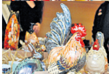
Osterbilder vom vielseitigen vielfältigen bunten Ostermarkt im 1. Stock Gundeli-Casino.

Österliche Stimmung dank dem OSTER KunstHandwerkMarkt im 1. Stock vom Gundeldinger-Casino, trotz Huddelwetter. Und das österli-