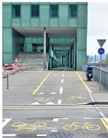
Der neue «Luxus-Veloweg» zwischen Merian- und Münchensteinerbrücke.

Auch für die Fussgänger wurde unter der gleichen Partnerschaft eine gefahrenfreie und ebenfalls unter Dach verlaufende Verbindung erstellt. Sie liegt eine Etage höher über der Velopiste. Insgesamt 4,4 Millionen Franken wurden in das Gemeinschaftswerk vom Kanton investiert. Darin ist rund die Hälfte der Baukosten enthalten, die andere Hälfte, weitere 4 Millionen Franken wurde von der IBO übernommen. Die am Anschluss der Münchensteinerbrücke erstellte neue Lichtsignalanlage garantiert den Pedaleuren eine problemlose Überquerung der verkehrsreichen Mün-