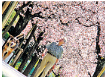
Prachtvolle Frühlingsstimmung an der Bruderholzallee.

Sodeli, jetzt ist der Frühling gekommen. Haben wir auch verdient, nach diesem Winter. Und so konnten wir für einmal österliche Gefühle, wie sonst im Tessin, ohne Gotthardstau am schönen Rhein, oder auf dem Bruderholz, oder im Garten, oder mir einem Spaziergang oder einem Ausflügli in der Region und und und geniessen.