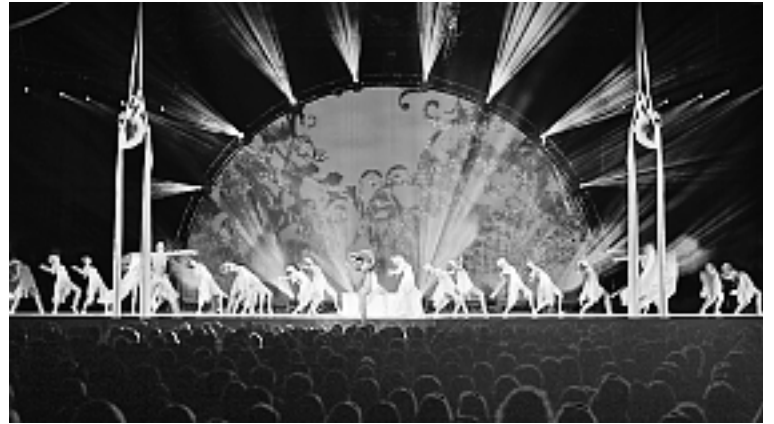
Weltklasse: Das internationale SkyDance Ballett.