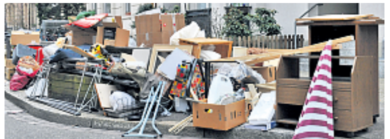
Kein Durchkommen: Anfangs April sah es im ganzen Gundeli-Quartier aus wie auf einer grossen «Müllhalde». Geplant war eine Aktion für «Brennbares». Nur dies haben die Anwohnerinnen und Anwohner nicht verstehen wollen und stellten gerade alles raus! Inklusiv Metall, Elektro-Schrott bis hin zu giftigen Sonderabfällen...

Koffer, Fauteuils, Schränke, Bettgestelle aus Holz, und Sofas sowie Matratzen standen da auf denn Boulevards und Strassen herum, sondern auch viele andere Dinge, die an diesem Tag eigentlich gar nicht hätten nach draussen gestellt werden dürfen. An gewissen Orten im Gundeli präsentierte sich am Morgen des Sammeltags eine Kulisse wie in einer seit Jahren verlassenen Goldgräberstadt im Wilden Westen. Nach den Worten von Alex-