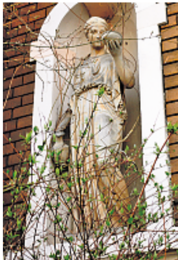
Nischenfigur an der Villa Bruderholzstrasse 20: Hebe, die Göttin der Jugend. Foto: W.G., April 2009.

Für die Zukunft: Aus Fehlern lernen, d.h. sich rechtzeitig um die Kunst- und quartierhistorisch wertvollen Bauten unseres Quartiers kümmern und notfalls für ihren Erhalt zu sorgen (wie z.B. 1967 für das Thomas Platterhaus)... Darum Achtung: empfehle ich jetzt schon Bruderholzstrasse 33 «Gundeldinger Krippe von 1903» (Architekten La Roche & Stähelin) unserer Aufmerksamkeit. Werner Gallusser