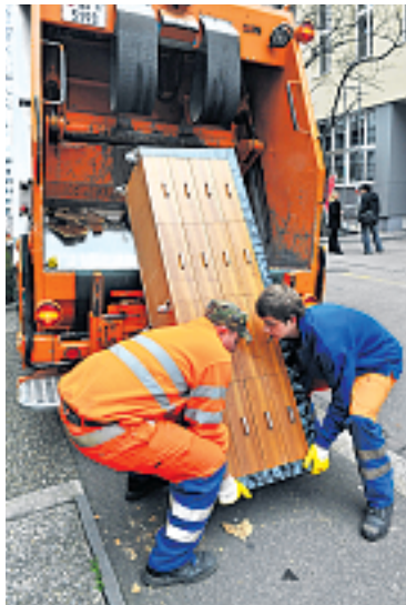
... Ein grosses Lob geht an die Mitarbeiter der Stadtreinigung. Nach 2 Tagen war der ganze Müll weggeräumt und die Strassen wieder sauber. Danke und Bravo!

Durch eine neu zu schaffende Eckverbindung Margarethenbrücke-Birsigviadukt (Viaduktstrasse) beim BVB-Liniennetz würde die Möglichkeit geboten, eine umsteigefreie Tramverbindung ab Allschwil und Pratteln/Muttenz über eine Entlastungslinie via Güterstrasse direkt zum Südportal der SBB-Passarelle herzustellen. Damit würde die Innenstadt, vor allem aber auch der bei Stosszeiten überfrequentierte Centralbahnplatz merklich entlastet. Zumals zahlreiche Pendler auf die S-Bahn-Linien fixiert sind, die in Gundeli-Nähe auf den Perrons 14 und 16 ihren Ausgangspunkt haben. Dies die Grundidee, die zur Einreichung des parlamentarischen Vorstosses geführt haben. Nicht zuletzt, weil in den kommenden drei bis fünf Jahren die Erneuerung des Schienennetzes in dieser Zone eingeplant ist.