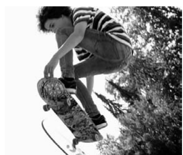
Europäische Spitzenskater an der EM auf unserer «Kunschti».