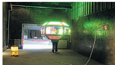
Im «Klingeli» zu sehen: «Mayor-Mom» von dem Künstler-Duo Bernhard Bretz und Matthias Holliger.

GZ. Noch bis zum Sonntag, 27. September ist im Ausstellungsraum Klingental an der Kasernenstrasse 23 (ehemalige Kirche des Klosters Klingental) eine Installation der Künstler Bernhard Bretz (*1980) und Gundelianer Matthias Holliger (*1974) zu sehen. Das Künstlerduo löst mit seinen Installationen etwas Gesamthafes in mögliche Bestandteile auf. Diese Bestandteile, beispielsweise heute/gestern/morgen, innen/ausser, real/imaginär/surreal werden neu kombiniert, in Material übersetzt und aufgebaut. Damit ergeben sich neue Orte und es entstehen ungesehene Situationen, Parallelwelten treffen aufeinander und machen damit Ordnungen sichtbar, die unter Umständen auch anders sein könnten. Im Ausstellungsraum Klingental ist eine