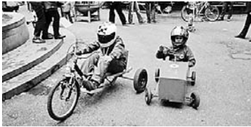
«Sausende Kisten» am 6. September im Margarethenpark.

GZ. Die Medaillen und Pokale stehen bereit – denn das Piragua-Team der Robi-Spiel-Aktionen organisiert die 2. Auflage des Inferno-Seifenkistenrennes im Margarethenpark. Mitmachen können und dürfen Alle, welche wagemutig die Inferno - Strecke unter ihre Räder ihrer Vehikel nehmen wollen! Für eine Teilnahme ist eine eigene Seifenkiste Bedingung, welche unbedingt über taugliche Bremsen verfügen muss! Ebenso muss jeder Fahrer/-in seinen Kopf mit einem Helm schützen.