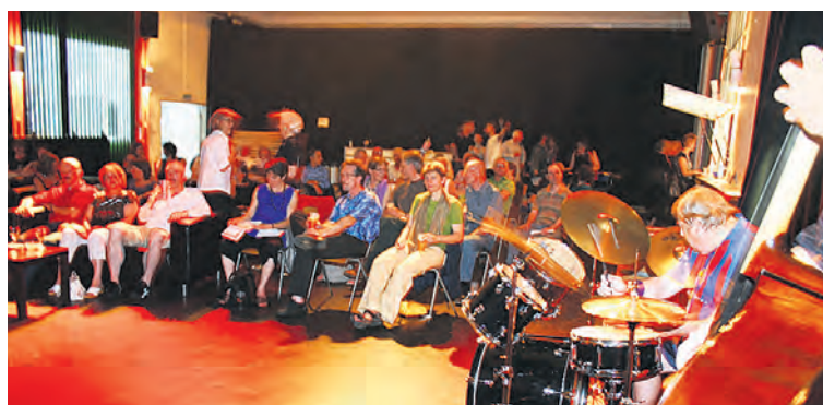
Viel Publikum an der 1. Film-Party «Gundeli» in der Querfeldhalle.

Ein sehr differenziertes Bild vom Quartier zeichnet der Zeitungsträger und Denker Roland Baumgartner . Er erlebt das Gundeli als