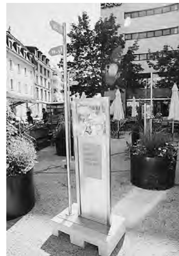
Wanderausstellung «gewissenloses Abfallverhalten der Konsumgesellschaft» auf dem Tellplatz.

Bewusstsein dringen, so dass sie auch wahrgenommen und genutzt werden. Ob die eindringliche Botschaft auch in breiteren Bevölkerungskreisen wahrgenommen wird und diese ihr Litteringverhalten grundlegend zu ändern gewillt sind, wird zumindest erhofft. Jeder für sich allein muss und soll sich fragen, ob er seiner Umwelt ein danken- und gewissenloses Verhalten noch weiterhin zumuten kann. Die Hoffnung stirbt zuletzt. ■