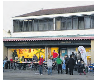
Der Kultur- und Quartiertreffpunkt «Oase» Bruderholz muss per Ende Juni geschlossen werden.

Für die «Oase» auf dem Bruderholz bedeutet der verheerende Bericht aus dem Verwaltungshaus des grünen Bruderholzbewohners Guy Morin das abrupte Ende einer nicht mehr aus dem Quartierleben wegzudenkenden, weil stark genutzten Institution. Dabei war vor-