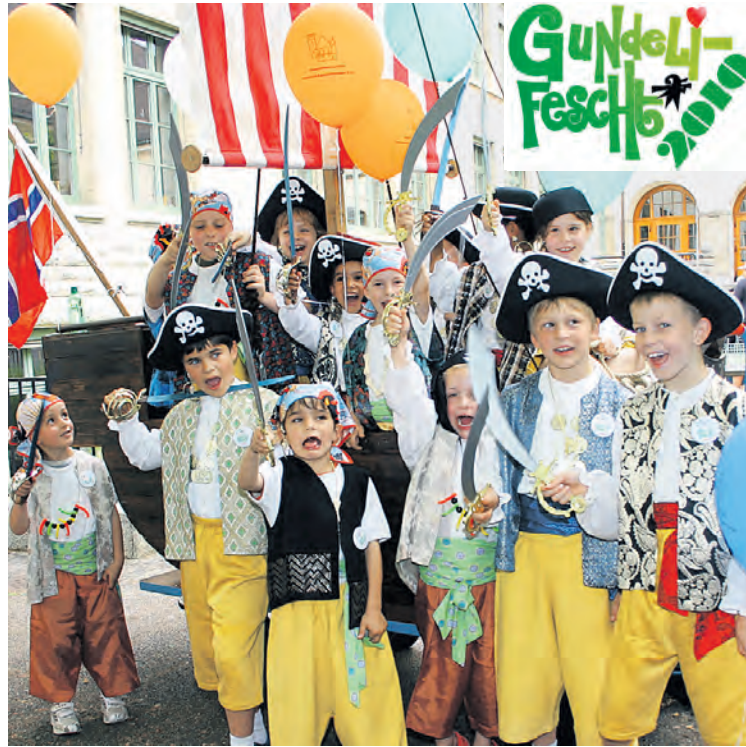
«Klar zum Entern!» – Die furchterregenden Piraten am Gundeli-Fescht 2010. Mehr dazu auf den Seiten 12, 13, 15, 17 und 21 in dieser Ausgabe.