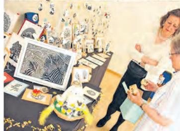
Oster KunstHandwerkerMarkt im Gundeldinger Casino.