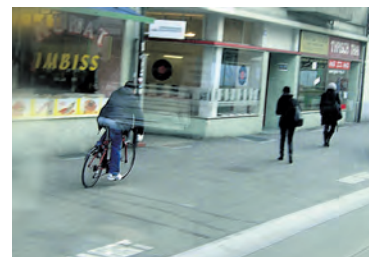
Kamikaze-Velofahrer: «Auf die Fussgänger, fertig, los!» Unsägliche Situation in der «Boulevard» Güterstrasse, leider nicht selten.

Die Pro Velo bemängelt die Kapthaltestellen als «mehr Fluch als Segen» und solche Kapthaltestellen gibt's es eben in der neugestalteten (!) Güterstrasse, dem so tollen «Boulevard». Allerdings könnte sich ja Pro Velo auch mal intensiv mit dem Fahrverhalten ihres Klientels be-