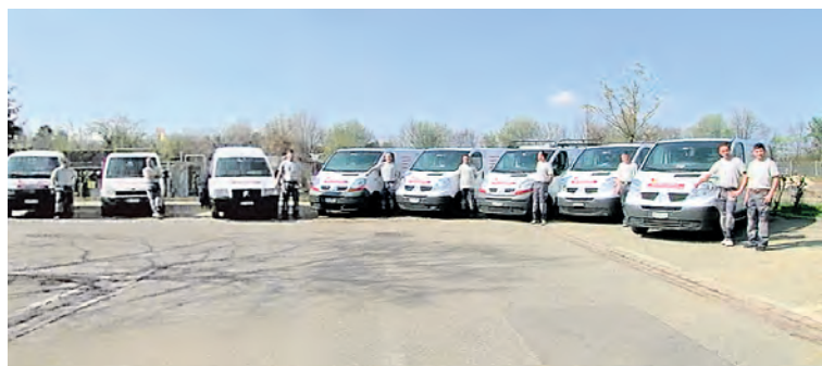
Sorgen für eine rasche, günstige und flexible Auftrags erledigung. Das Zerey-Parkett GmbH-Team.

Boden-Produkte alles für den Innenbereich: grosse Auswahl an Parkette, Lamine (Kunstharzbeschichtet) PVC, Teppiche etc. Dank langjähriger Erfahrung, gepaart mit günstigen Preisen, Zuverlässigkeit und exaktes Arbeiten, werden auch sie zufrieden mit «Zerey» sein. Verlangen Sie unver-