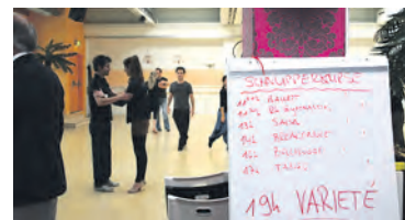
10 Jahre Tanzpalast Basel im Gundeli, Güterstrasse 82.