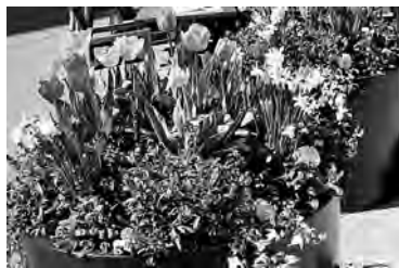
SP Grossrätin Sibylle Benz wünscht mehr Pflanzkübel – wie hier auf dem Tollplatz – auch in der «Boulevard» Güterstrasse!

Es wurden Aktionen gestartet, vermehrte Polizeikontrollen unternommen, die Quartierorganisationen haben mit einer lustigen Postkartenaktion auf die Situation aufmerksam gemacht. Da jedoch all dies nichts nützt, muss sinnvollerweise mit leichten baulichen Massnahmen das Parkieren verhindert werden. Allerdings wünscht sich niemand mehrwöchige Bauarbeiten. Es besteht Konsens, dass nur leicht einzurichtende Massnahmen vorgenommen werden sollen, da sonst wieder für mehrere Wochen wertvolle «Boulevard-Lebensqualität» verloren ginge. Solche Massnahmen wie u.a. das Aufstellen von grossen bepflanzbaren Kübeln wurden von der IGG Interessengemeinschaft Gewerbe Gundeldingen dem Baudepartement vorgeschlagen bzw. erbeten.