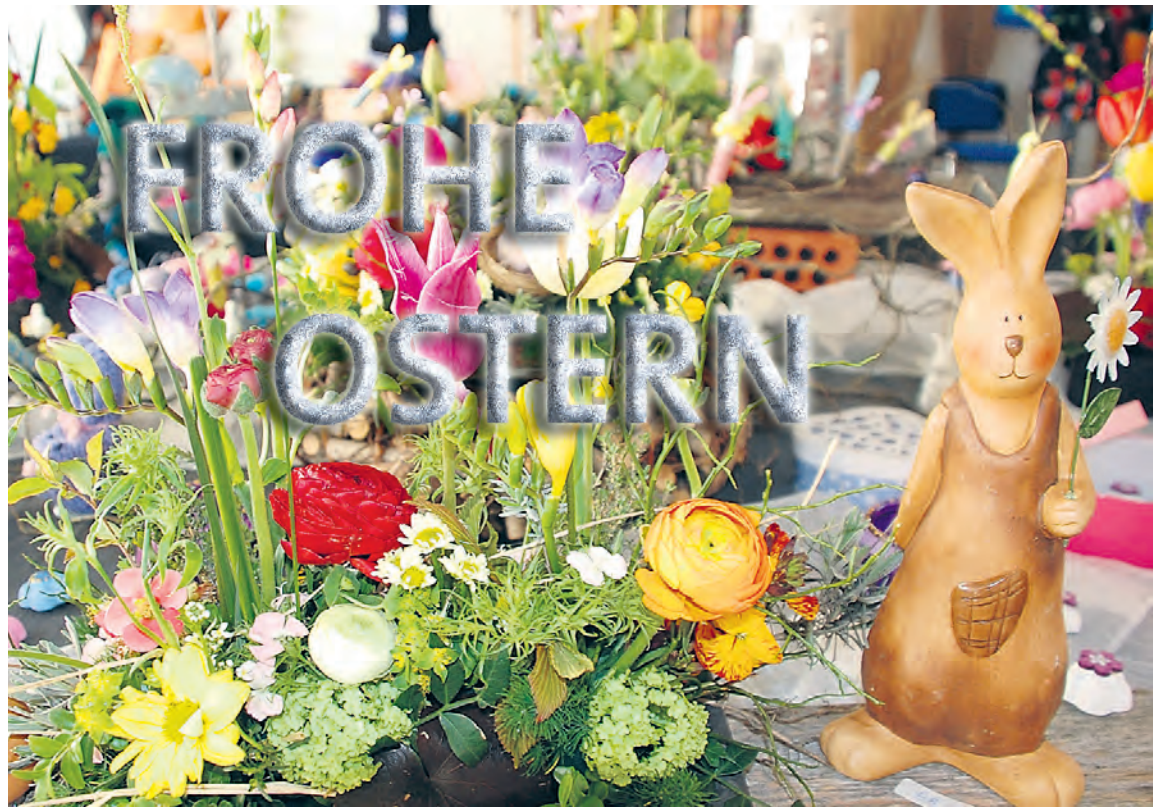
GZ. Dieses passende Bild - zu «Frohe Ostern» - lieferte uns Martin Graf vom vergangenen OsterKunstHandwerkerMarkt im Gundeldinger Casino. - Das GZ-Team wünscht Ihnen eine frohe und erholsame Osterzeit. Viele tolle Geschenk-Ideen für Ostern und Muttertag finden Sie in dieser Ausgabe.