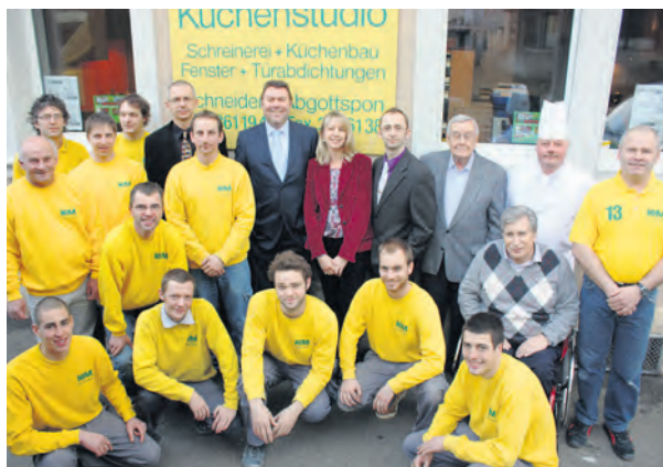
Das KM-Küchenstudio Schreinerei Team.