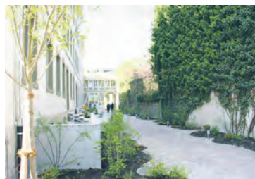
Eine weitere Aufwertung im Gundeli: Die «Grüne Oase» zwischen Reichensteiner- und Margarethenstrasse.

Die Stiftung Habitat , mit Sitz an der Rheingasse 31/33 im Kleinbasel, hingegen lud die Nachbarschaft zur neuen Grünen Oase im Gundeli, entstanden an der Reichensteiner-