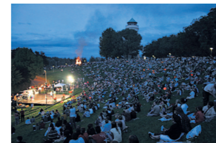
Die «Rütlwiese» am Fusse des Wasserturms Bruderholz.

Programmänderungen vorbehalten. Die Feier wird bei jeder Witterung durchgeführt! Infos: www.bundesfeierbasel.ch