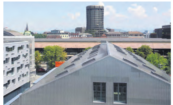
Das neue Solardach an der Güterstrasse 133.

GZ. Die im Gundeli domizilierte Pensionskasse Stiftung Abendrot hat auf ihrer Geschäftsliegenschaft Güterstrasse 133 Solarzellen installiert, die den Strombedarf von 20 Haushalten decken. Die Anlage ist die erste in Basel, die ein ganzes Ost-Westdach mit Solarzellen bedeckt. Als Pensionskasse, deren erklärtes Ziel es ist, das Alterskapital der Versicherten nach ethischen, ökologischen und sozialen Gesichtspunkten anzulegen, investierte die Stiftung Abendrot z.B. in die Revitali-