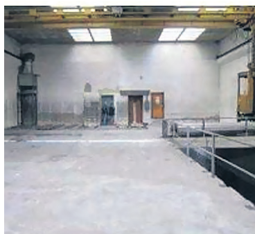
Unter dem «Rietschi-Dach» (siehe Foto Seite 1, Nr. 1) befinden sich grosse Lagerhallen.

Nach dem Kauf des Areals (2800 Quadratmeter), für den die Pensionskasse Abendrot 13 Millionen Franken investierte, wurde die von der Christoph Merian Stiftung (CMS) finanziell unterstützte Vorplanung stark intensiviert. Die CMS stellte 30 000 Franken zur Realisierung einer Projektstudie zur Verfügung. Die