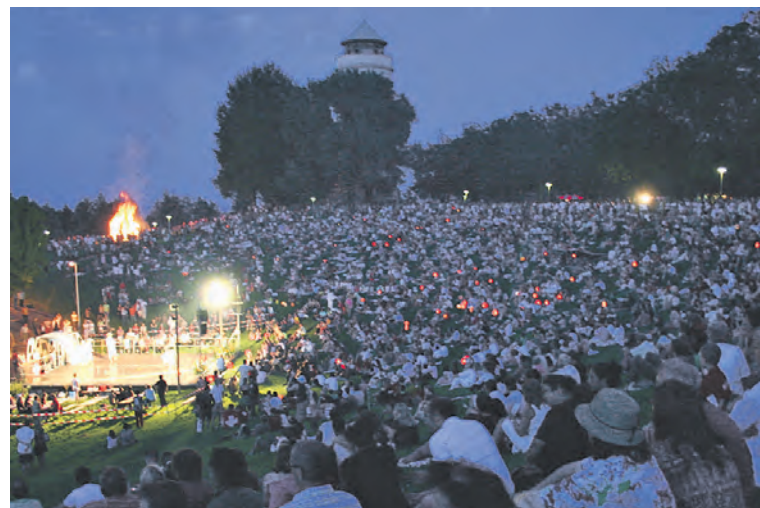
Jedes Jahr verfolgen tausende das Bühnenprogramm auf der «1. August-Rütli-Wiese» (Bühne u.l.) beim Wasserturm auf dem Bruderholz