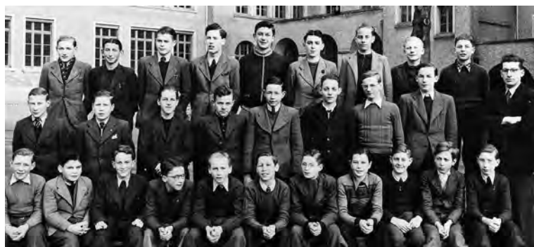
KRS 4a, 22.3.1944, Thiersteiner Schulhof. Auf diesem Bild fehlen schon 11 Mitschüler wegen vorzeitigem Schulaustritt.