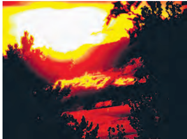
Gewitter über Basel.

Was für ein Wetter - im Mai hoch-sommerlich heiss, im Juni durchzogen, im Juli dafür kalt-nasses April-Wetter, inklusive «Jahrhundert-Gewitter» - fotografisch festgehalten von Martin Graf . Ich glaube das