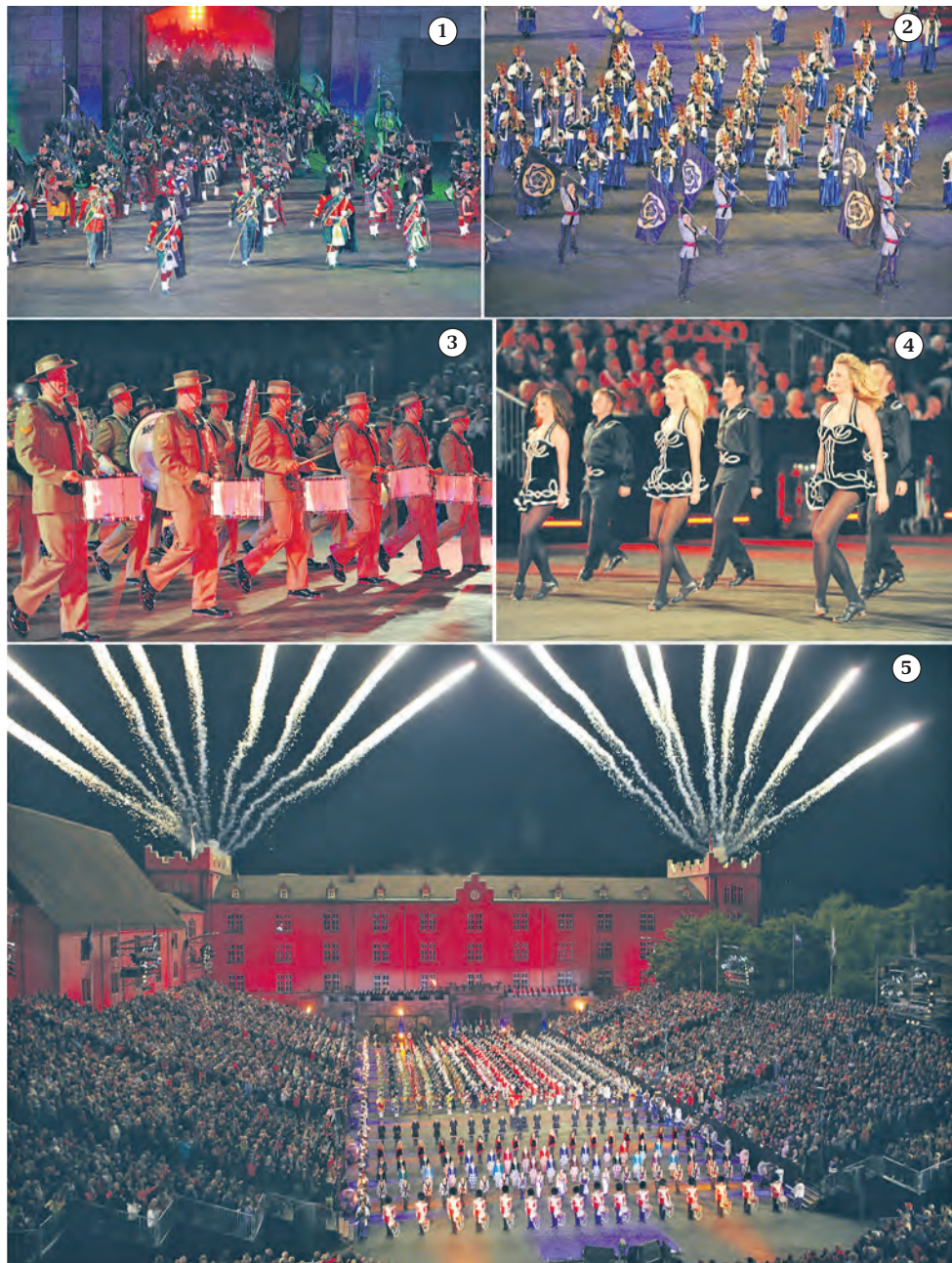
Fotos von der Super-Tattoo-Show 2011: 1) Masses Pipes & Drums. 2) Band of the Australian Army Band Corps. 3) Aimachi Marching Band (Japan). 4) Celtic Stars, Irish Dance. 5) Ein sensationelles Schlussbild ist Benno Hunziker dieses Jahr gelungen und würdigt damit die

glied) für diesen Fehler! Wir haben in der Bildlegende vom Gundeli-Fescht-Apéro anstatt Urs Hugo, Andreas Aellig (auch IGG-Vorstandsmitglied) geschrieben. Ihri Boulevard-Amsle