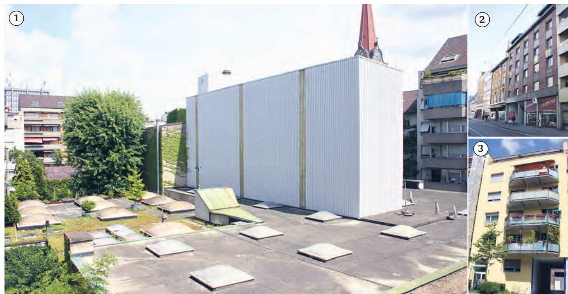
Wird das Rietschi-Areal (Überdachung, Foto 1) im Hinterhof (Geviert) zwischen Güterstrasse 244 (Eingang/Einfahrt, 2), Dornacherstrasse 243 (Durchgang, 3) und Thiersteinerallee/Liesbergergerstrasse für die Bevölkerung geöffnet? Ähnlich wie das Gundelinger Feld? Mehr dazu auf Seite 3.