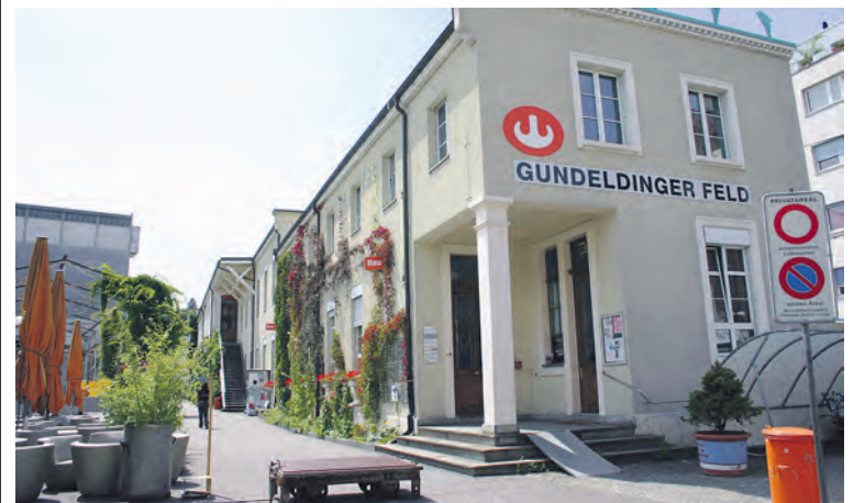
Das FAZ Familienzentrum Gundeli befindet sich in der Halle 2 (rechts) auf dem Areal des Gundeldinger Feldes (Dornacherstrasse 192).

Auskünfte FAZ: Tel. 061 333 11 33. Detailliertes Programm zur Jubiläumsfeier: www.quartiertreffpunktebasel.ch