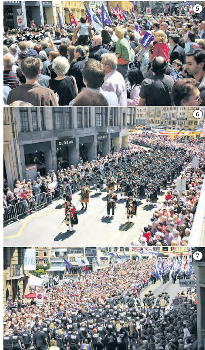
Mega Tattoo-Parade 2011: 5) Auch am Marktplatz verfolgten zehntausende von Schaulustigen die Tattoo-Parade mit 2'000 Akteuren. 6) Pipes and Drums in der Eisengasse. 7) Eindrückliche Kulisse auch auf der Mittleren Rheinbrücke. (Danke an Interdiscount, Filialleiter Thomas Gardini, dass wir - zum Fotografieren - auf die Terrasse durften).