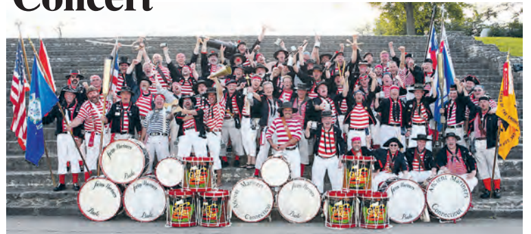
Das Swiss Mariners Fife und Drum Corps Basel.

Vorführung: Pausenhof Schulhaus Clara, Samstag, 20. August von 19.15 bis 23 Uhr (Konsumation ab 17 Uhr). Der Anlass wird bei jeder Witterung durchgeführt. Ticketpreis: 45.-, Vorverkaufsstellen: Peter Stalder Immobilien, Claragrab 83 und Büchler Trommelbau, Leimenstrasse 43a.