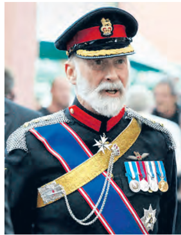
Hoher Besuch am Basel Tattoo: Mitglied der englischen Königsfamilie HRH Prince Michael of Kent.

... und was für eine Ehre! Am Montag, 18. Juli beehrte HRH Prince Michael of Kent (als Mitglied der englischen Königsfamilie vertritt er das englische Königshaus bei offizi-