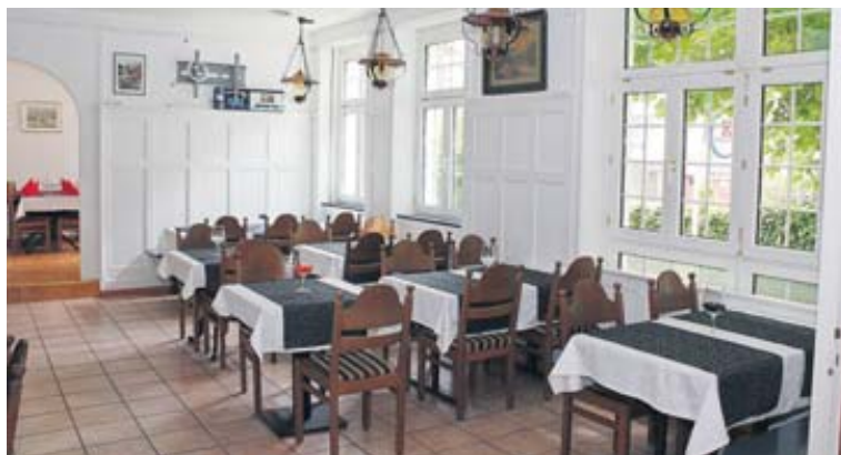
Frisch und hell präsentiert sich der herausgeputzte «neue», alte Delsbergerhof mit CH-Küche und Pizzas.

oder eher im gemütlichen warmen Innenraum im Winter, der Delsbergerhof lädt zum Verweilen ein. Im Angebot sind eine einfache Auswahl an gluschtigen Schweizer Spezialitäten und Pizzas sowie erfrischende Salate und Wurstsalate. Jeden Tag werden Mittagsmenus zu Fr. 9.80 sowie ein vegetarisches