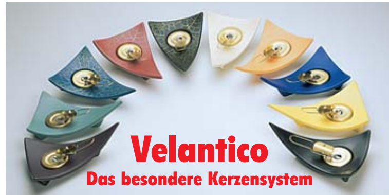
Velantico Das besondere Kerzensystem

In dieser Ausgabe präsentieren wir Ihnen Leserangebote zu attraktiven Preisen. Alle Angebote sind solange Vorrat lieferbar. Senden Sie uns den vollständig ausgefüllten Bestelltalon oder bestellen Sie bequem telefonisch oder über das Internet. Sie können Ihre Bestellung nach vorheriger Terminvereinbarung auch in MuttENZ abholen.