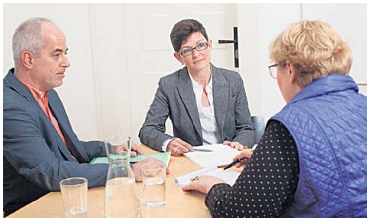
Im Gespräch den Überblick erlangen.

Liebe Leserin, lieber Leser, wir befinden uns mitten in der besinnlichen Vorweihnachtszeit, der sogenannten Adventszeit. Doch jetzt mal eine ehrliche Frage an Sie: erleben Sie diese Zeit als besinnlich? Oder werden Sie auch von der allgemeinen «Vorweihnachtshektik» überrollt? Muss auch alles noch fertig gemacht werden, wie wenn im 2016 nicht mehr gearbeitet werden dürfte? – Alles eilt, alles pressiert, alles muss «unbedingt noch dieses Jahr» erledigt werden. Und das Resultat davon? Am Abend schleppen Sie sich müde nach Hause durch die Dunkelheit. Oder Sie müssen noch nach der Arbeit einkaufen gehen, um den Lieben zu Hause etwas zum Abendessen aufzutischen zu können und