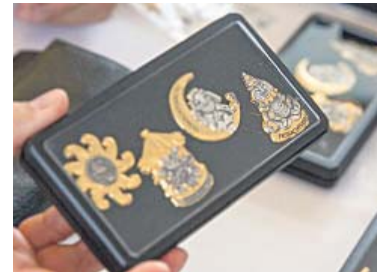
Die neue Blaggedde gibt es auch im Geschenk-Böxli.

ganzen Stadt. Im Gundeli finden Sie die nächste Vorverkaufsstelle im MIGROS Dreispitz (1. Stock beim Kundendienst). ■