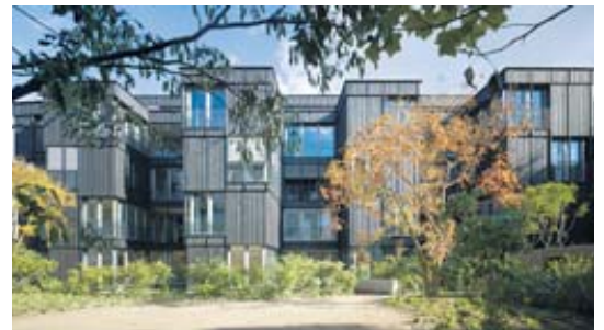
Vom Heimatschutz Basel prämiert: Neubau Wohnhäuser an der Sempacherstrasse 51/53.

durchgang her erschlossen werden. Kernstück im wahrsten Sinne ist aber der Bau im Hof (Sempacherstrasse 53) mit seinen 24 Wohnungen. Auf den ersten Blick fallen die Fassadenverkleidung mit dunklen Holzpaneelen und die Fassadenstruktur mit ihren tiefen Einschnitten auf, um die herum die Wohnungsgrundrisse angeordnet sind. Die Bewohner blicken nicht nur ins