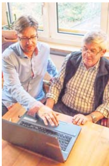
Pascal Stauffer erklärt Ihnen langsam und Schritt für Schritt die Bedienung von PC's, iPad's, externe Datenträger etc.

STS bietet altersgerechte Informatikkurse an. Das Angebot an Kur-