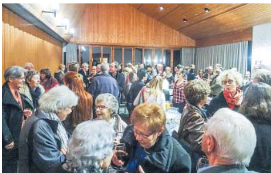
Konzertpause im Gerhardt Saal.