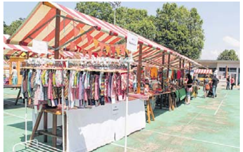
Auch das OK Gundeli-Fescht nutzte dieses Jahr die Fläche der Kunsti um ihr alljährliches Fest durchzuführen.

Kundendienst der festliche Weihnachtsbaum. Geschmückt ist der Baum mit Wunschzetteln von 160 Seniorinnen und Senioren aus Alters- und Pflegeheimen in der Region Basel.