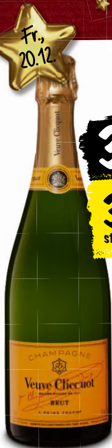
Champagne Veuve Clicquot, brut, 75 cl (10 cl = 4.38)