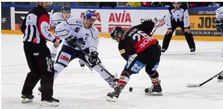
Der EHC Basel mischt in der Tabelle ganz zuvorderst mit.