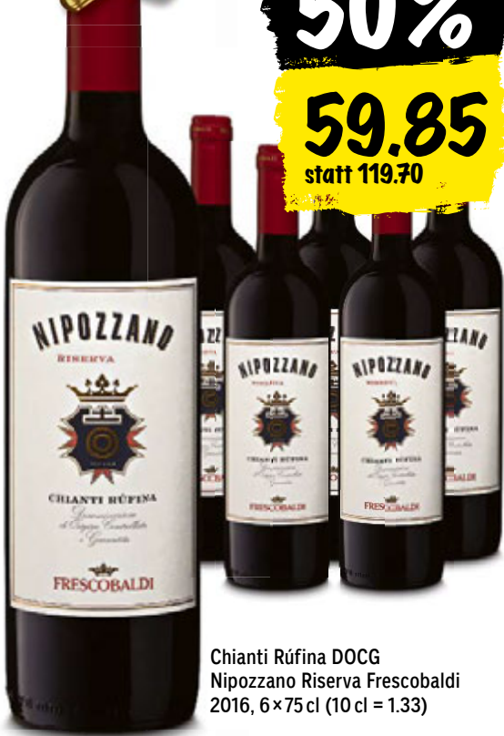
Chianti Rufina DOCG Nipozzano Riserva Frescobaldi 2016, 6 x 75 cl (10 cl = 1.33)