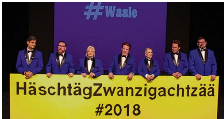
Was und wen häschtägen das Häbse-Ensemble alles am Mimösli 2020?