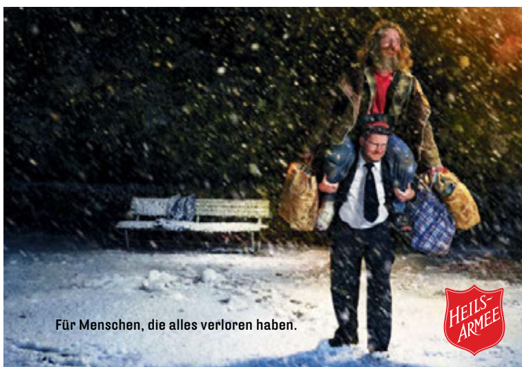
Für Menschen, die alles verloren haben.