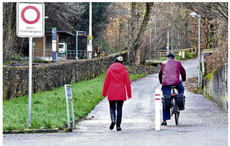
Platz für Velos und Fussgänger. In Kürze dürfen Velofahrer ohne Elektrounterstützung in der Wolfschlucht-Promenade bergauf fahren. Die Signalisation wird geändert.

Mittelfristig ist vorgesehen, die Veloführung auf das Bruderholz gemäss Teilrichtplan Velo via Wolfschluchtweglein und Lerchenstrasse einzurichten. ■