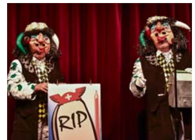
... und wir sind auf den Gundeli Värs von «s spitzig Ryssblei» gespannt.

oder via Kasse unter Telefon 061 691 44 46. Es gibt auch komfortable «Hospitality-Plätze»: hospitality@haebse-theater.ch