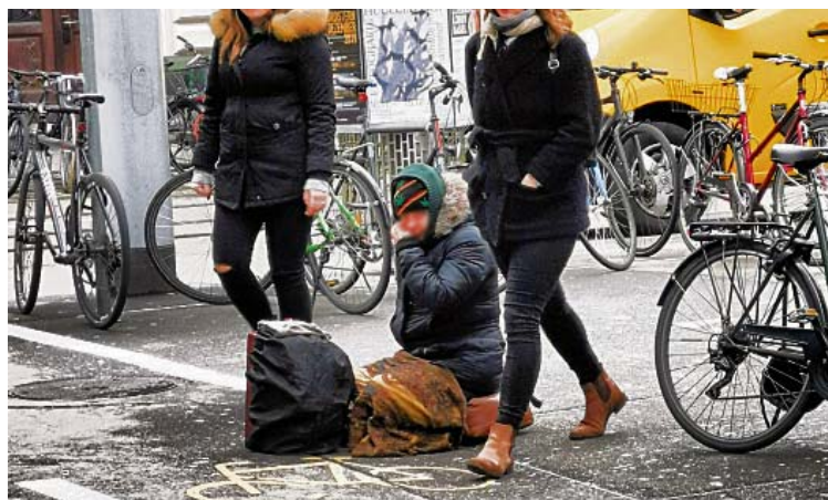
Sammeln bzw. betteln für einen «gemeinnützigen Zweck» ist erlaubt, aber nicht für die Weihnachtsbeleuchtung Gundeli.

Ich bemühte mich einerseits bei der Allmendverwaltung eine Bewilligung zu bekommen, um auf dem Tellplatz zwei Stunden sammeln zu dürfen. Andererseits ersuchte ich bei den SBB auf dem Meret Oppenheim-Platz um ein OK, dort weitere zwei Stunden sammeln zu können. Unser Ansinnen wurde von beiden Orten abgelehnt. Die Argumente sind (er-)schlagend: Das «Label» mit den drei Königinnen ist besetzt für die Caritas. Geld sammeln darf man auf öffentlichem Grund nur, wenn es gemeinnützig ist. Unter Gemeinnützigkeit versteht der Kanton z.B. WWF oder «Vier Pfoten». Eine Weihnachtsbeleuchtung ist nicht gemeinnützig.