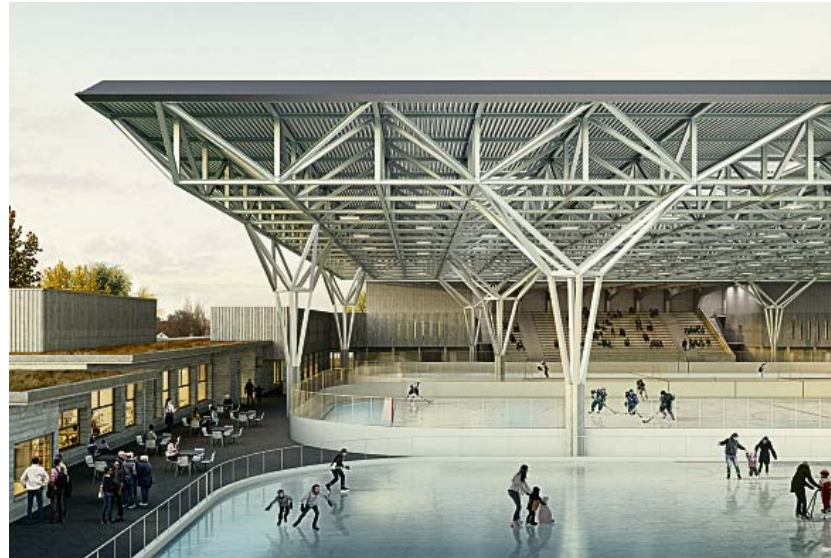
Visualisierung der neuen Kunsti Margarethen mit vergrößerter Überdachung.

Wie bisher sollen insgesamt drei Eisfelder zur Verfügung stehen. Ein Feld ist für das freie Eislaufen vorgesehen. Auf zwei Feldern kann Eissport betrieben werden. In Zukunft werden diese beiden Hockeyfelder überdacht sein. Dieses Dach dient als Schutz vor der Witterung und reduziert zugleich dank der aufgetragenen Dachdämmung den Energieverbrauch zur Erzeugung des Kunsteises um bis zu 30 Prozent. Auf dem Dach wird eine Photovoltaikanlage installiert. Auf