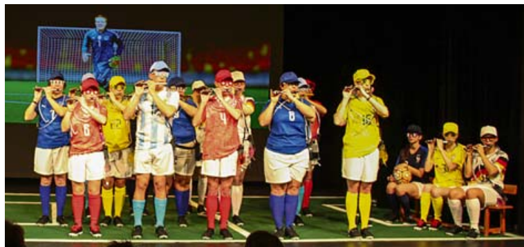
Was zaubert die «piccognito»-Pfeifergruppe nächstes Jahr auf die Bühne?