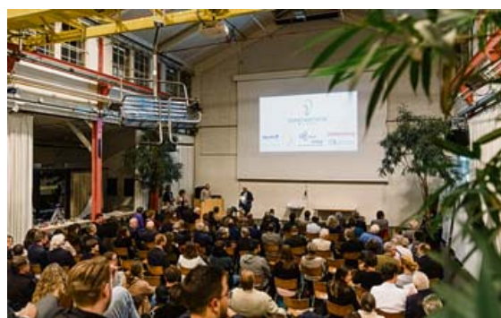
Die Prämierung fand in der Halle 8, Launchlabs im Areal des Gundeldinger Feldes statt.

Weitere Infos: www.innovationbasel.ch . ■