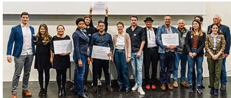
Gruppenfoto mit den Innovationspreis-Siegern.

tour». «Industrienacht Basel», das Siegerprojekt, hat einen starken Bezug zur Wirtschaftsregion Basel. Die «Industrienacht Basel» ist eine übergreifend organisierte Gemeinschaftsveranstaltung verschiedenster Firmen der Region. Sie dient der Öffentlichkeitsarbeit der Industrien und soll der Basler Bevölkerung einen unkomplizierten Zugang zur Wirtschaft und Industrie ermöglichen. Regionale