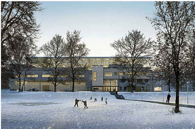
Visualisierung der Kunsti von vorne. Die Garderoben unten auf der Wiese werden verschwinden.

der nutzbaren Dachfläche von ca. 4100 m 2 können 740 kWp erzeugt werden.