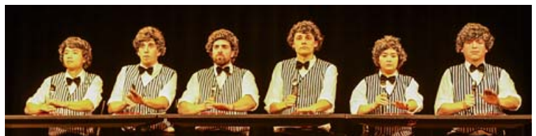
Mit welcher Show werden die «Rötzilisgge» überraschen?