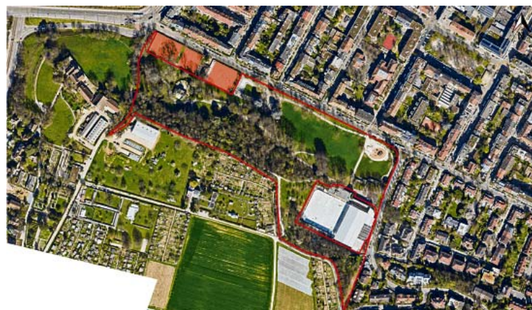
Orthofoto mit Projektperimeter.

eine öffentliche Toilette sowie Materialräume der Stadtgärtnerei. Diese Nutzungen sollen zukünftig