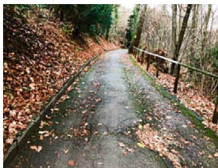
Viele Wege im Margarethenpark sind in einem schlechten Zustand.

Der Margarethenpark grenzt an die Quartiere Gundeldingen und Bruderholz, befindet sich jedoch auf dem Gebiet des Kantons