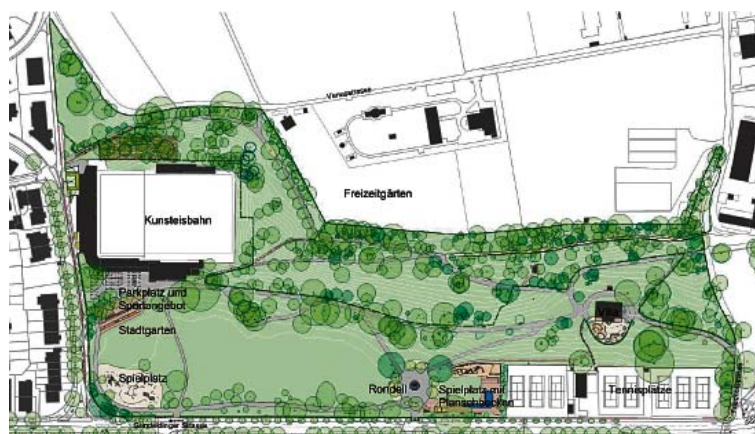
Das überarbeitete Vorprojekt, Januar 2019.