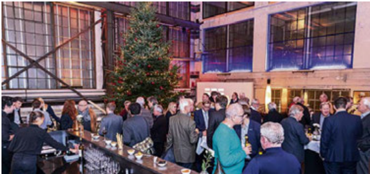
Nach der Diskussionsrunde offerierte der Mittelstand Basel, in der Halle 7 auf dem Areal des Gundeldinger Feldes, noch einen Apéro.

Weitere Infos: Mittelstands-Vereinigung Basel, www.mittelstand-basel.ch