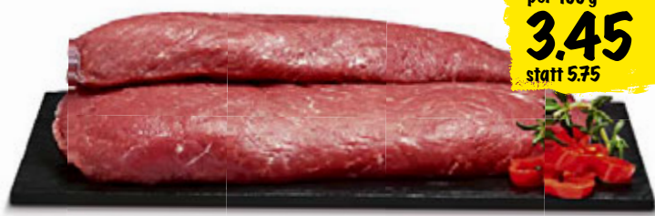
Coop Lammierstück, Grossbritannien/Irland/Australien/Neuseeland, in Selbstbedienung, 2 Stück, ca. 400 g