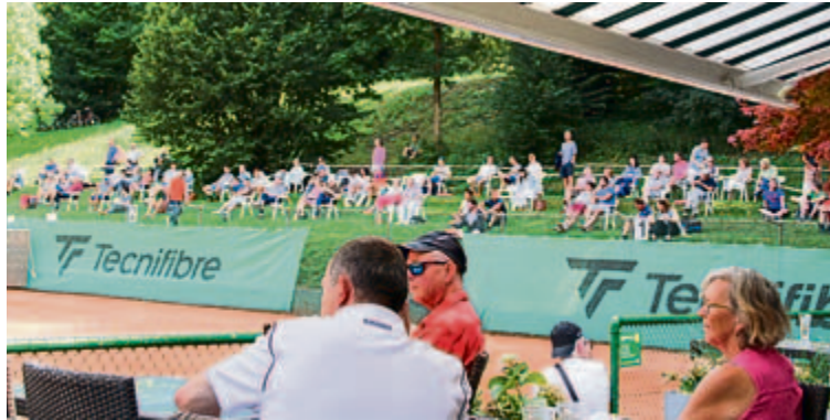
Endlich wieder mal eine Veranstaltung im Gundeli: Tolle Tennisstimmung an den Crossklinik Basel Tennis-Open auf der BLTC-Anlage im Margarethenpark.