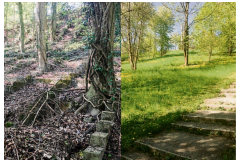
Südlich der Kunsteisbahn werden die Tribünenreste abgebrochen und eine Waldwiese angelegt.