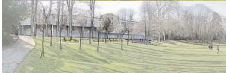
Erweiterung der Grünfläche mit Bäumen und einer Rasenterrasse mit Loungemöbeln.