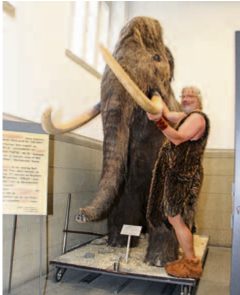
Unsere «Gundella», hier mit Mammutier, bleibt dieses Jahr im Stall.

Wir sind überzeugt, dass alle, die gerne dieses Jahr an unserem Mammutumgang teilgenommen hätten, Verständnis für unseren