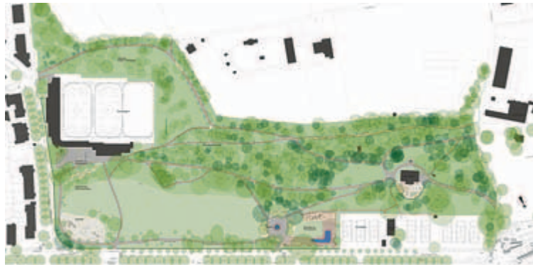
Gestaltungsprojekt für die Sanierung des Margarethenparks.

Eine Möglichkeit zur Erweiterung der Grüns ergibt sich im Bereich des Garderobengebäudes unterhalb der Kunsteisbahn. Mit der Sanierung und dem Umbau der Kunschti können sowohl die öffentliche Toilettenanlage als auch das Magazin der Stadtgärtnerei im Gebäude der Kunsteisbahn untergebracht werden. Das Garderobengebäude kann dann abgebrochen und die Grünfläche erweitert werden. Im Grün- und Freiraumkonzept Gundeldingen war die zentrale Forderung die qualitative und quantitative Verbesserung der Freiraumversorgung. Hier besteht jetzt Möglichkeit, um im dichten